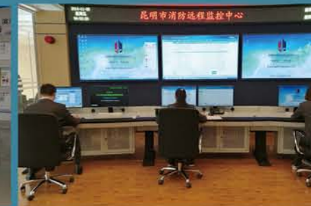
昆明市消防远程监控中心