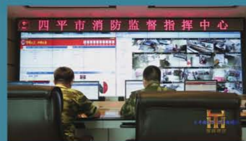
吉林四平市消防远程监控中心