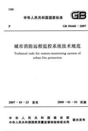
国标 GB50440-2007 《城市消防远程监控系统技术规范》

公安部关于印发《建筑消防设施及火灾报警远程监控系统技术论证和推广应用座谈会纪要》的通知，指出“要大力推进和规范消防安全远程监控系统建设及应用工作”。