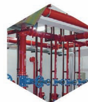
消防设施状态不明