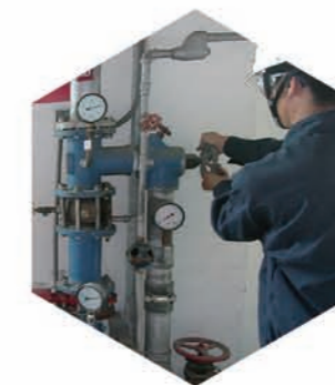
设备维修状态不明