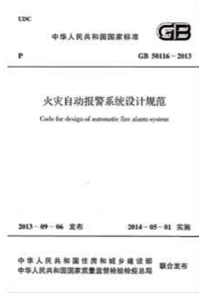
国标 GB50116-2013 《火灾自动报警系统设计规范》