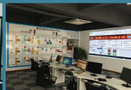
浙江鼎仁建筑消防设施联网项目