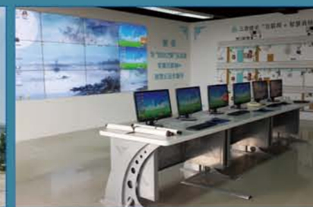
昆山三意楼宇互联网-智慧消防联网项目