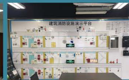
安徽蜀山区消防远程监控中心