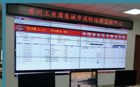
苏州工业园区消防远程监控中心