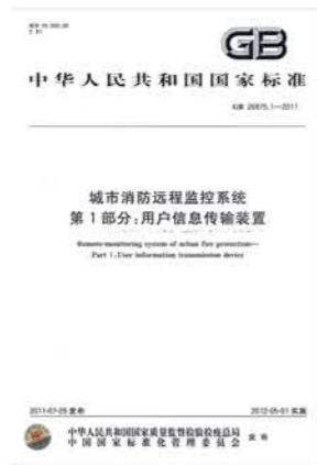
国标 GB26875-2011 《城市消防远程监控系统》