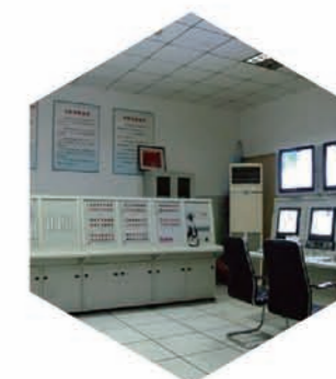
值班人员在岗情况不明