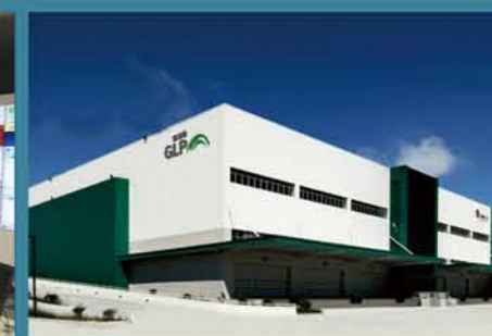
上海普洛斯物流园