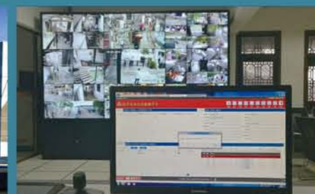
周庄古镇消防远程监控中心