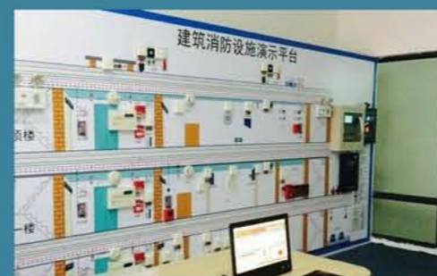
上海狮帝建筑消防联网项目